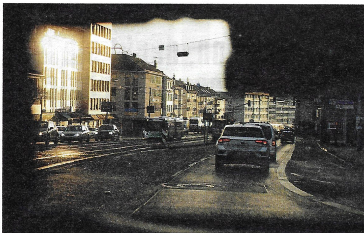
„Kontaktoffensive“: mit dem Jobcenter-Team unterwegs in Kassel